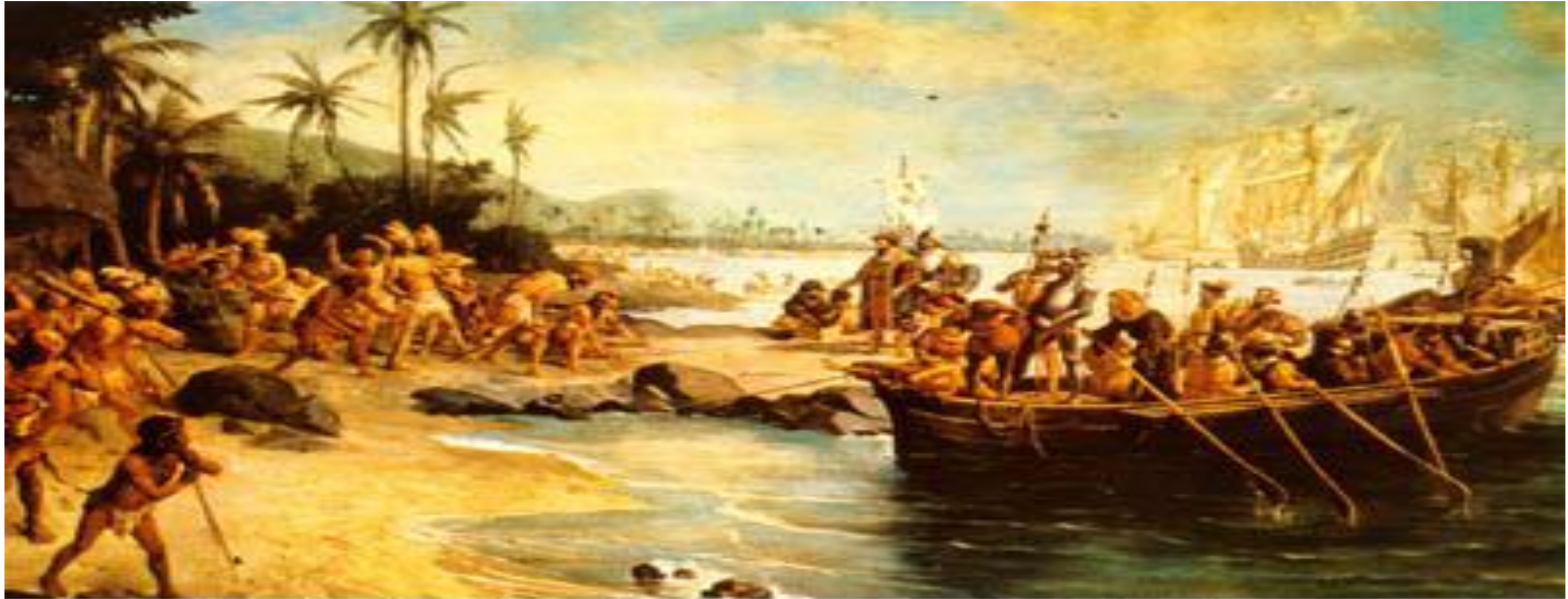
Oscar Pereira da Silva, Desembarque de Cabral em Porto Seguro, SP , Museu Paulista